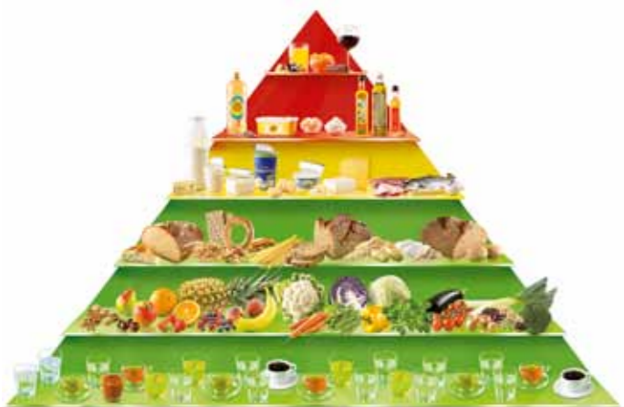
Die aid-Ernährungspyramide, © aid infodienst, Idee: S. Mannhardt

Zu einer ausgewogenen Ernährung gehört die ausreichende Zufuhr von Eiweiß, Fetten (möglichst ungesättigte Fettsäuren) und Kohlenhydraten.