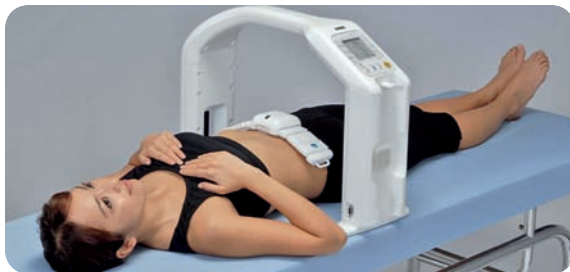
Messung des Bauchfettanteils