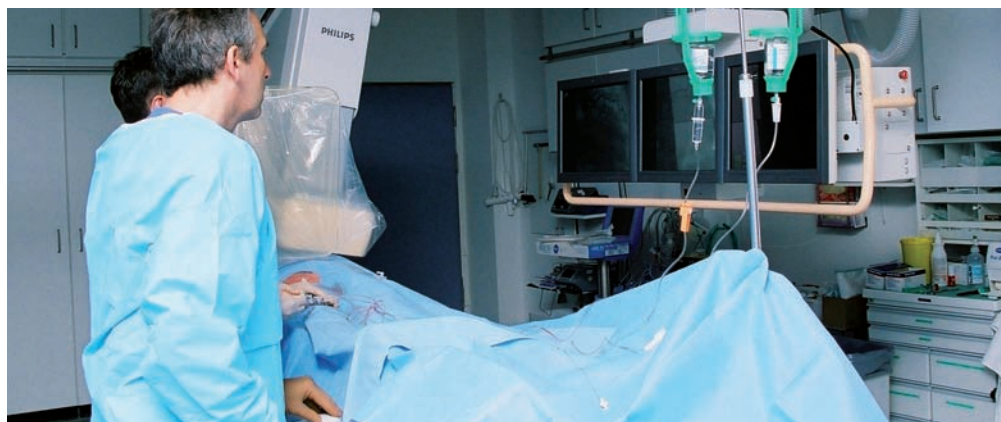
Steht am Klinikum Dachau rund um die Uhr zur Verfügung: der Herzkathetermessplatz

Plötzlich auftretende Brustschmerzen können Symptom einer ernsten Erkrankung des Herzens sein. Zu warten ist gefährlich: Je früher eine Behandlung beginnt, desto größer ist die Chance auf ein gutes Behandlungsergebnis. Deshalb sollten die Betroffenen nicht zögern, sondern sich unverzüglich an die Notfallambulanz am Klinikum Dachau wenden.