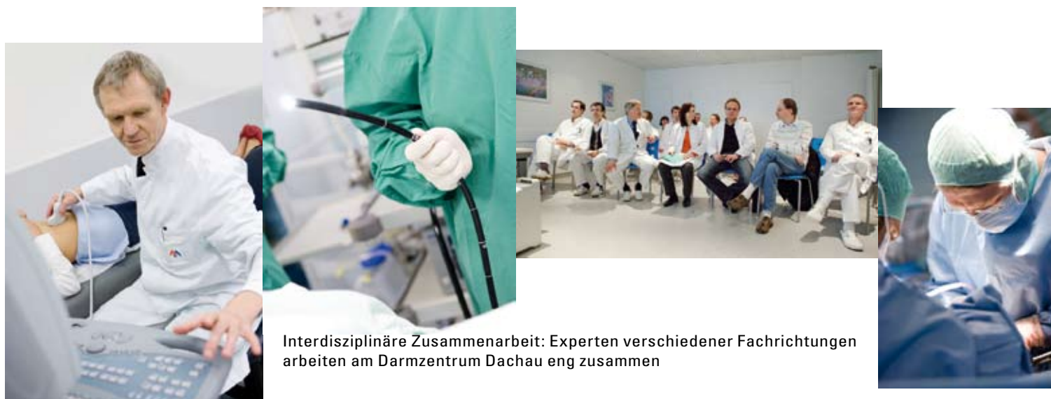
Interdisziplinäre Zusammenarbeit: Experten verschiedener Fachrichtungen arbeiten am Darmzentrum Dachau eng zusammen

Seit dem 1. Oktober 2010 besteht eine Qualitätspartnerschaft mit der DKV Deutsche Krankenversicherung AG. Ihr Ziel ist die optimale Versorgung von Patientinnen und Patienten bei Darmkrebs.