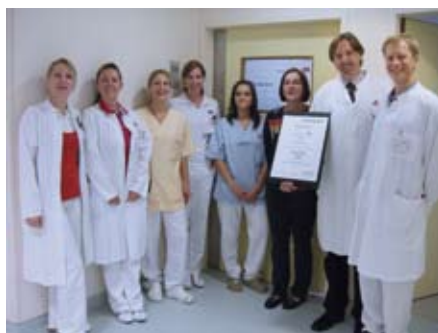
Das Team der Stroke Unit mit dem neuen Zertifikat

Die Zertifizierung wurde für drei Jahre erteilt. Danach wird erneut extern geprüft.